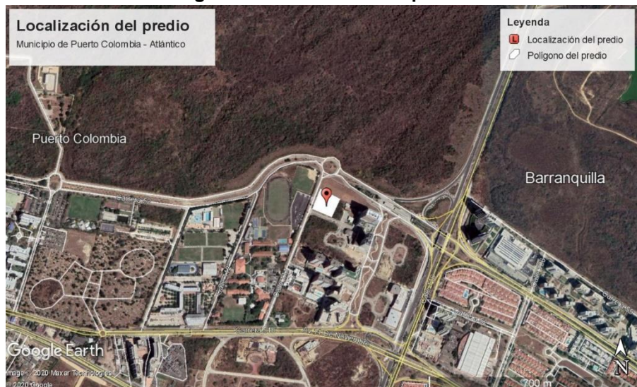
Figura 1. Localización del predio.

LOCALIZACIÓN: El predio donde se realizará el aprovechamiento forestal de árboles aislados se encuentra localizado sobre la Calle 111 con Carrera 53, en jurisdicción del municipio de Puerto Colombia – Atlántico (Figura 1). El bien inmueble, propiedad de SEGUROS DE VIDA SURAMERICANA S.A. con NIT: 890.900.266-3, es denominado como Lote C1 de la Urbanización Portal del Genovés II, y está identificado con la Matricula Inmobiliaria N° 040-491841 de la Oficina de Instrumentos Públicos de Barranquilla y Registro Catastral N° 01-03-0189-0013-000.