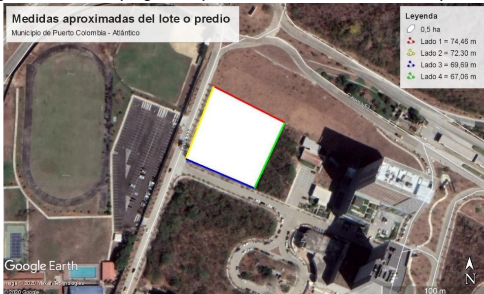
Figura 2. Tamaño del polígono del predio donde se hallan los árboles a aprovechar.

También es pertinente aclarar que, de acuerdo a la revisión del polígono suministrado en el Plan de Manejo y Aprovechamiento Forestal , la CRA encontró que el área del lote o predio donde se hallan los árboles a aprovechar corresponde a (0,5) ha aproximadamente. (Figura 2) y no a 0,25 ha.